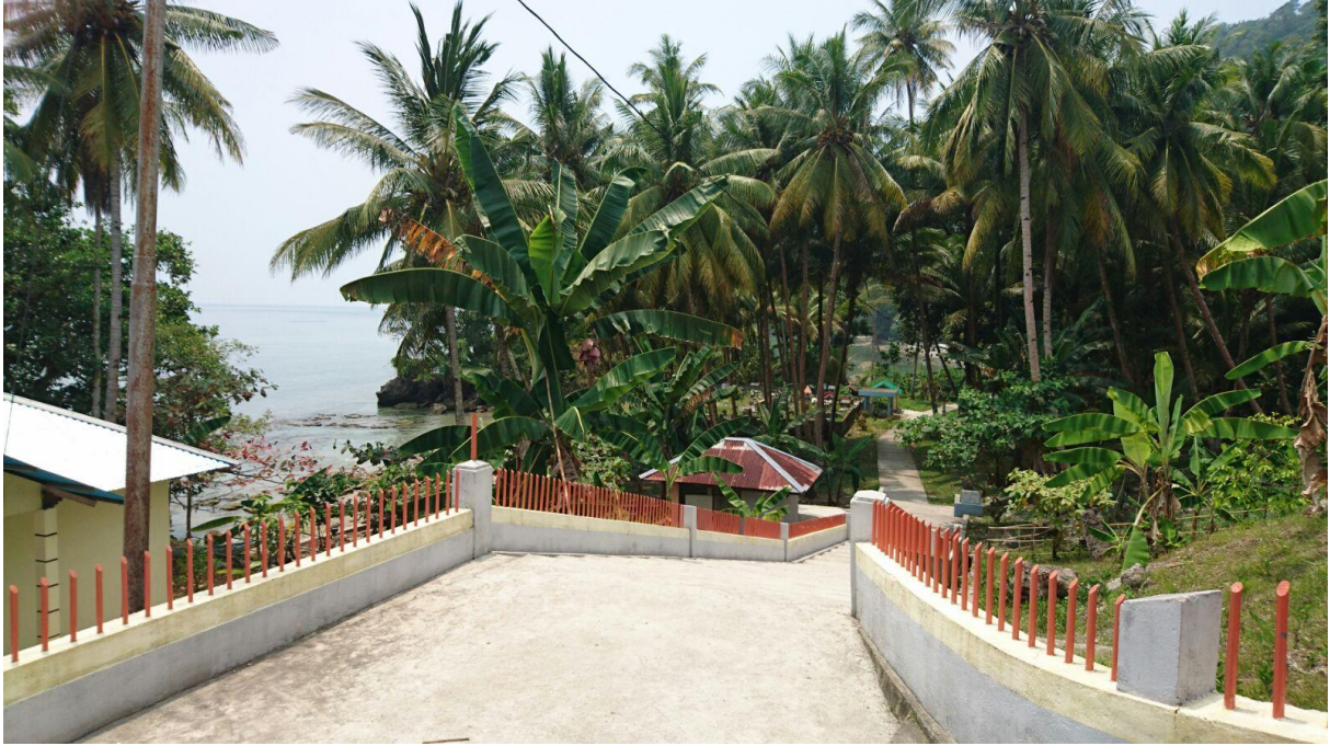
Booi: Rumah adat