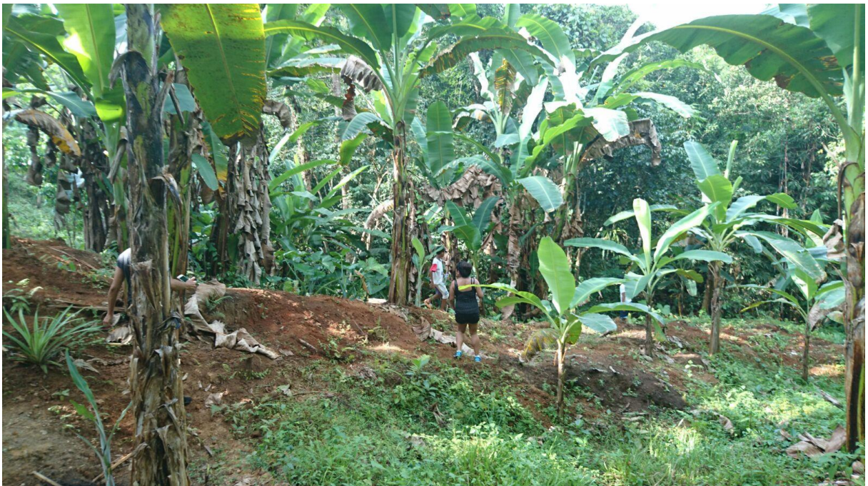
Hative Besar: richting Air Terjun (waterval)